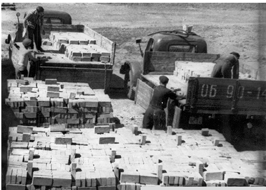
КАЧЕСТВО КИРПИЧА - ОТЛИЧНОЕ!