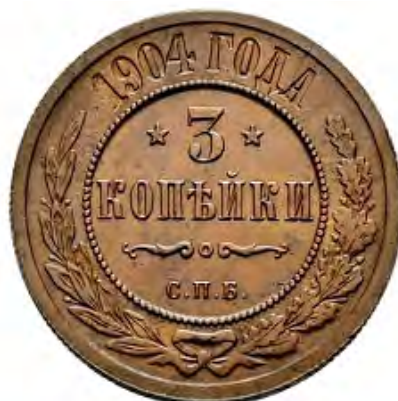
3 копейки 1904 года