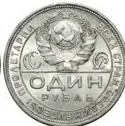
Рубль 1924 года

грамм чистого металла). На оборотной стороне монеты изображено, как молодой рабочий указывает пожилому крестьянину дорогу в «светлое будущее». Картина называется «Новая жизнь». На аверсе изображен герб Советского Союза, в нижней части монеты крупно указан номинал, по краю монеты надпись «Пролетарии всех стран, соединяйтесь!».