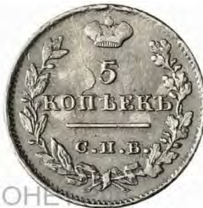
5 копеек 1823 года