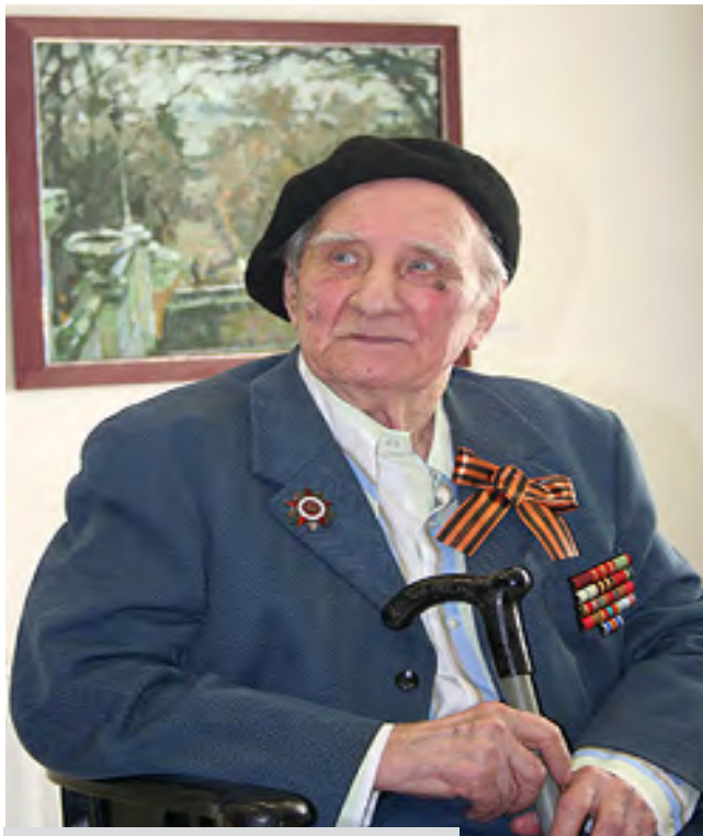
Художник В.Е. Романов