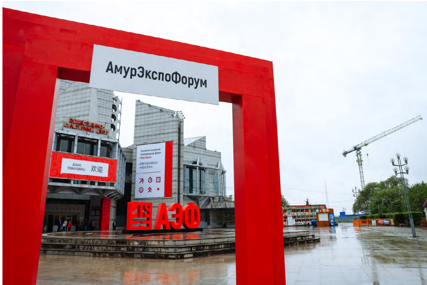
Продолжение. Начало на стр. 6

На пленарной сессии губернатор Приамурья Василий Орлов обсудил потенциал области в плане международного сотрудничества с помощником президента России Максимом Орешкиным и министром страны по развитию ДВ и Арктики Алексеем Чекунковым.