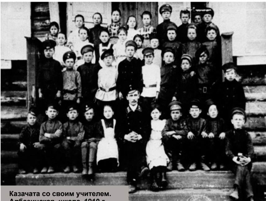
Казачата со своим учителем. Албазинская школа, 1910 г.

Несмотря на суровые школьные законы, грамотность возрастала. В 1873 году Амурскую область посетил сын императора Алексей Александрович, который выказал покровительство казакам и способствовал сбору средств на школьное строительство.