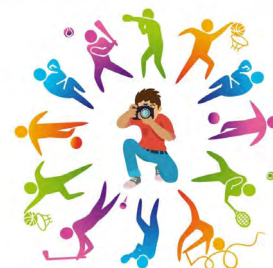
Фото и видео конкурс Фото и видео конкурс